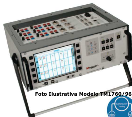
Foto Ilustrativa Modelo TM1760/96